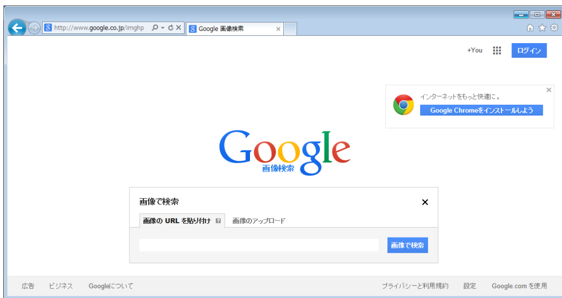
図 4. 画像で検索