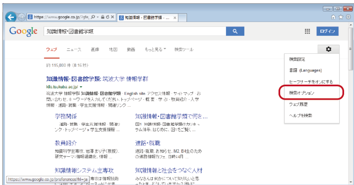
図 2. 「検索オプション」の場所