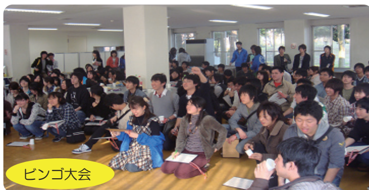
松野さんと学内探訪の新入生