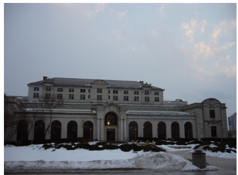
Memorial Union：フードコート、ブックスストア、ホテル、郵便局などがあります。