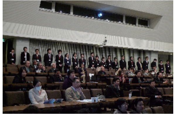
会議最終日に学生スタッフ（後ろに整列）が参加者に紹介され、大きな拍手を受けました。

2009年3月6日から3日間、図書館情報学教育に関する国際会議 A-LIEP2009（2009年アジア太平洋図書館・情報学教育国際会議）が春日キャンパスで開催されました。20ヶ国以上から約240名の参加があった大規模な会議で、約40名の学生もスタッフとして活動し、国際交流と学術研究の現場を肌で感じる貴重な機会となりました。