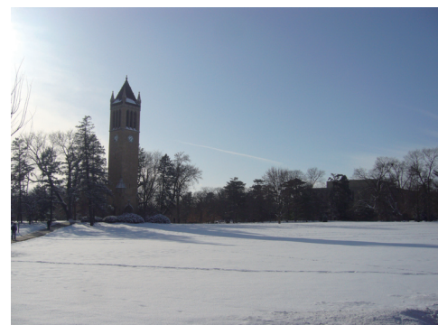
アイオワ州立大学時計塔の夏と冬