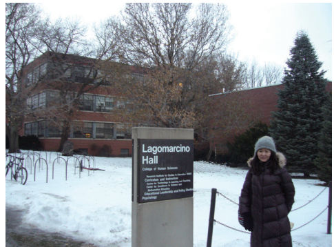
心理学部のあるLagomarcino Hall： ここが研究拠点になりました。