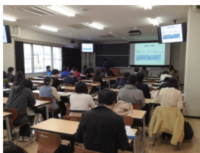
発表会の様子 (知識科学主専攻)