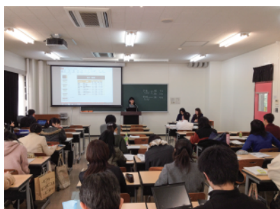
発表会の様子 (情報経営・図書館主専攻)

発表者はパワーポイントを用いながら研究成果を発表しました。その後、教員等の出席者と質疑応答を行いました。