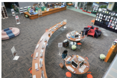
金沢大学附属図書館

筑波大の図書館との違いに触れることもでき、それぞれの大学の強みや課題について、図書館員と意見交換も行うことができたのは、とても有意義だったと思います！他大学のラーニング commons の工夫に刺激を受け、よりよい空間づくりについての考えを深めることができたのではないのでしょうか？