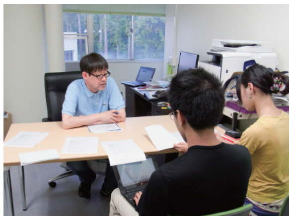
逸村先生に当時の様子をお聞きする