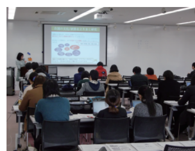
発表会の様子 (知識情報システム主専攻)