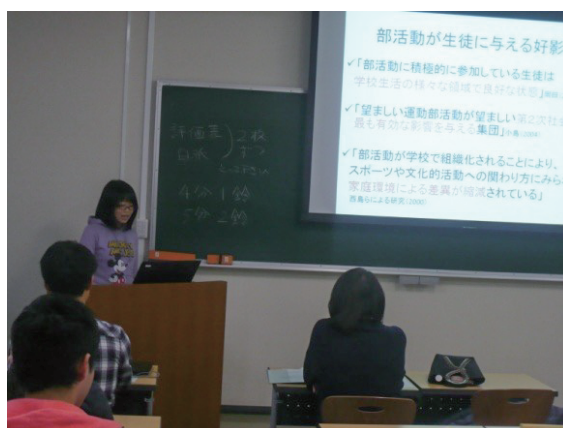
発表の様子、学んだコミュニケーション力を発揮！