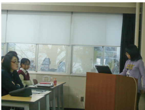
発表を見まもるクラス担任