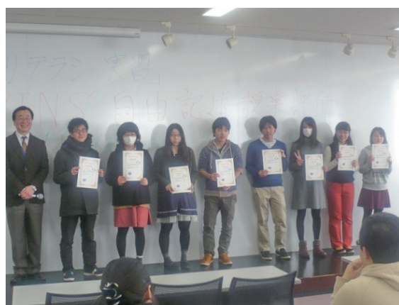
賞状を手し、よろこびの表情