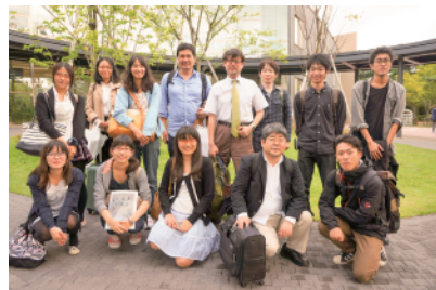
新潟大学附属図書館

1日目に訪問した新潟大学の中央図書館は、2013年リニューアルのとてもきれいな図書館でしたね。