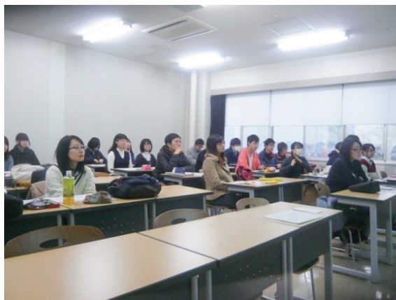
真剣な表情で発表を聴く学生たち